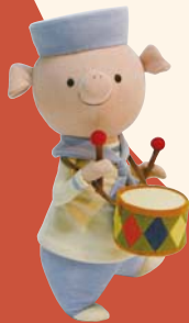
「カムのぬいぐるみ」 (製作:原優子) 2005年

●お問い合わせ ジェイアール京都伊勢丹 電話 075 (352)1111 (大代表)