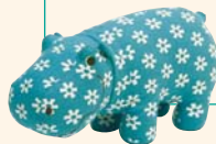
「ミーナの行進」ぬいぐるみ 2006年

※開館前にお並びいただく場合は、京都駅ビル大階段7階・美術館側入口にてお待ちください。 ※出演者やイベント内容が変更、または中止となる場合がございます。予めご了承ください。