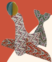
「パンチアウトアニマル」 2008年