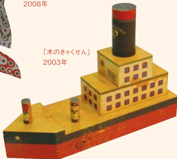
「木のきやくせん」 2003年